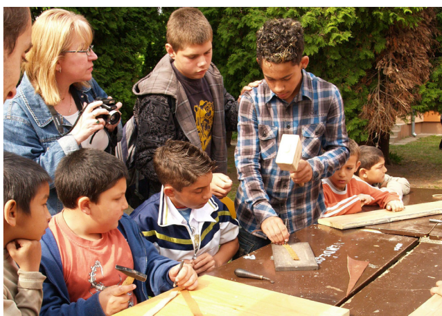
Práce s kožou