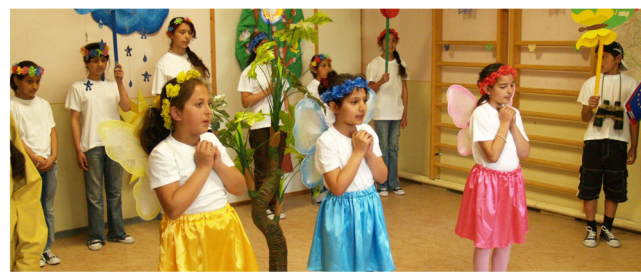
Z kultúrneho vystúpenia

K dosiahnutiu spoločných cieľov sú najvhodnejšími oblasťami šport, umenie, hudba a rôzne remeslá. Žiaci sa ich môžu zúčastniť bez komunikačných problémov. „Spoločný program vedie k tomu, aby sa žiaci so špeciálnymi potrebami ľahšie adaptovali do spoločnosti. Počas spolupráce každý národ prispieje svojimi vlastnými poznatkami a skúsenosťami, ktoré spejú k vyššiemu štandardu, aby žiaci dostali rovnakú šancu ku kvalitnej integrácii.